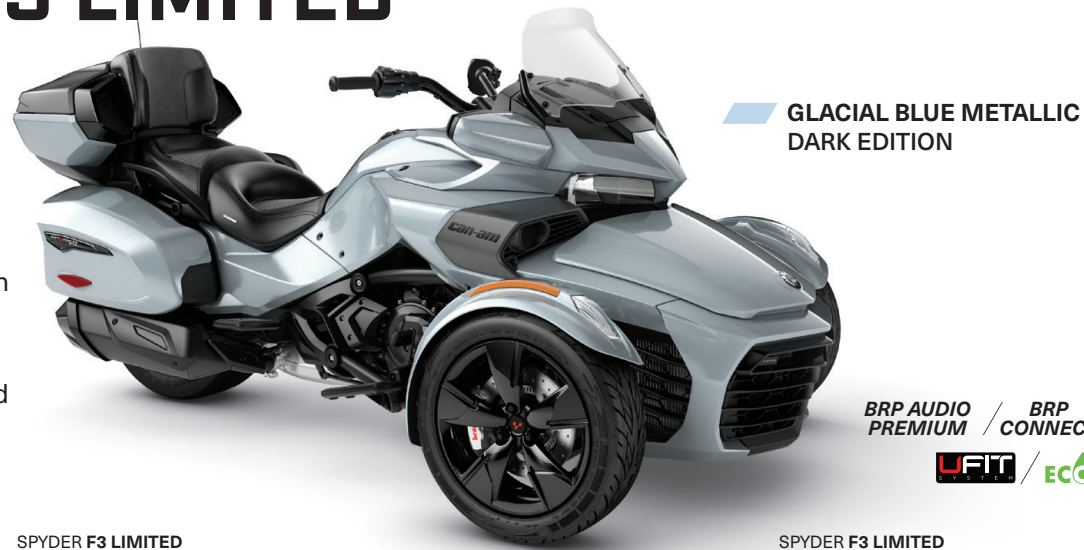
GLACIAL BLUE METALLIC DARK EDITION

BRP AUDIO PREMIUM / BRP CONNECT UFIT / ECO