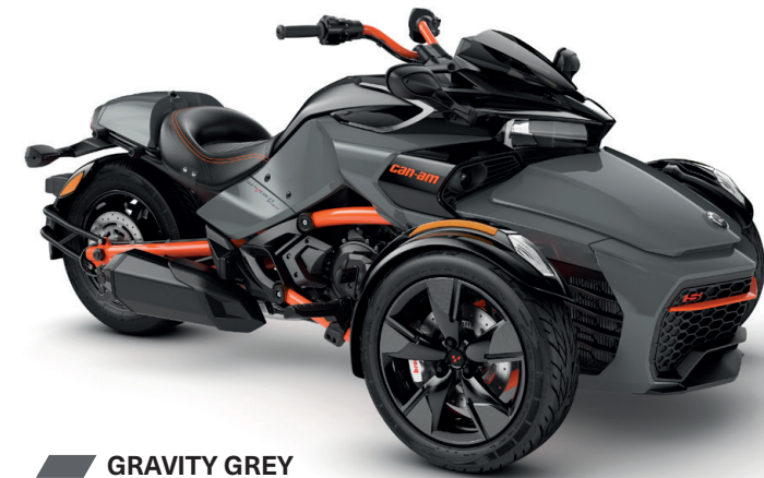
GRAVITY GREY SONDERSERIE