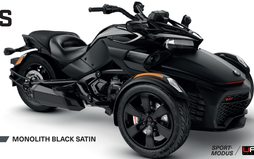
MONOLITH BLACK SATIN