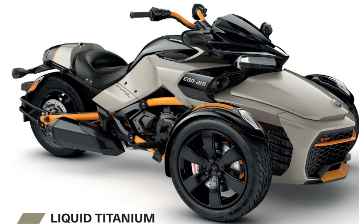
LIQUID TITANIUM SONDERSERIE