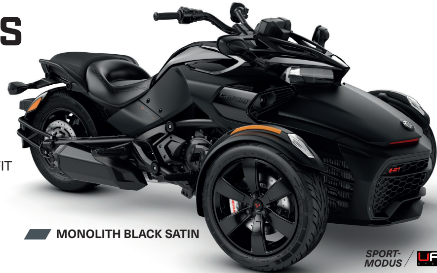
MONOLITH BLACK SATIN