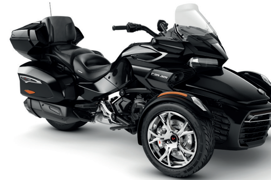
STEEL BLACK METALLIC* CHROME EDITION

BRP AUDIO PREMIUM / BRP CONNECT / UFIT / ECO