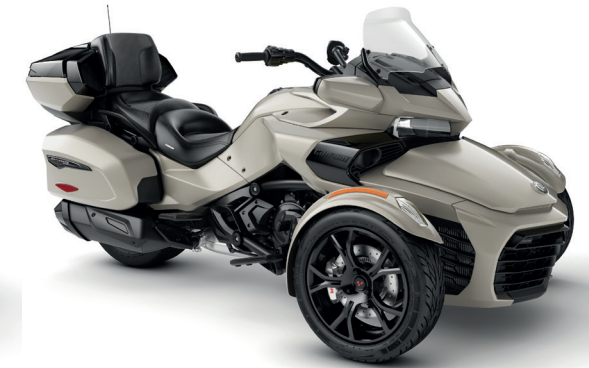
LIQUID TITANIUM DARK EDITION

* Teile und Verkleidungen in Chrome oder Dark Edition erhältlich