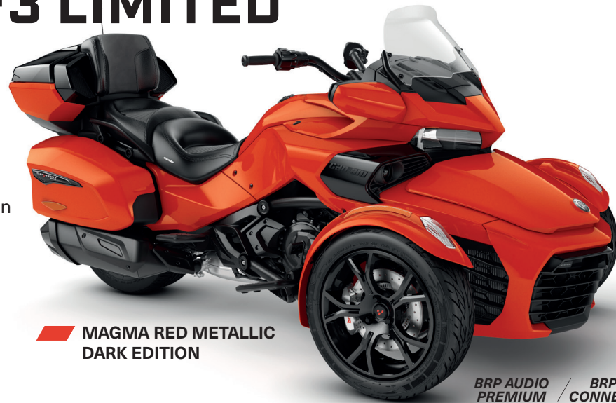
MAGMA RED METALLIC DARK EDITION

BRP AUDIO PREMIUM / BRP CONNECT / UFIT / ECO